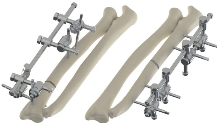
Metafizarni ili dijafizarni prelom radijusa