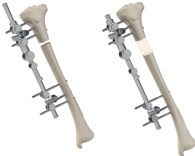
Konfiguracija komponenti na početku produženja